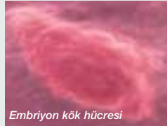
Embriyon kök hücresi

Ribozom Yapısı: 1999 yılı, hücrelerdeki ribozom adlı protein fabrikalarının ilk moleküler haritalarının çıkarılmasına tanıklık etti.