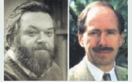
1999 Nobel Fizik Ödülü'nü paylaşan Hollandalı bilim adamları Gerardus 't Hooft (solda) ve Martinus J.G. Veltman

yapıları ve hareketleri üzerinde yürüttükleri kuramsal çalışmalar nedeniyle ödüllendirildiler. Böylece ödül beşinci kez parçacık fiziği alanında çalışmalar yürütmüş bilim adamlarına verilmiş oldu. İsveç Bilim Akademisi'ne göre 't Hooft ve Veltman, "parçacık fiziği kuramını daha sağlam matematik temellere oturtular; özellikle de fiziksel büyüklüklerin ayrıntılı hesapları için kuramın nasıl kullanılacağını gösterdiler. Ödülün açıklanması parçacık fizikçileri arasında sevinç yarattı ve pek çok araştırmacı, hesaplamalarında iki bilim adamınca geliştirilen kuramsal çerçeveyi güvenle ve başarıyla kullandıklarını vurguladılar. 't Hooft ve Veltman'ın geliştirdiği çerçeve, 1995 yılında ABD'deki Fermilab laboratuvarında Üst kuark'ın kütlelerinin hesaplanmasına temel oluşturdu. İki fizikçinin geliştirdiği kuramın temel önermelerinden biri de, tüm öteki parçacıklara