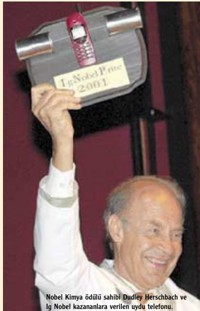
Nobel Kimya ödülü sahibi Dudley Herschbach ve İğ Nobel kazananlara verilen uydur telefon.

Evrenimiz, dünyamız, hatta yaşamımız bir zıtlıklar bütünü. Madde; karışımaddeyle birlikte var. Birçok kozmolog, evrenimizin ayna karşılığı olduğu görüşünde. Sosyal yaşamımız da öyle. İktidar var, muhalefet var. Yaşamımızı biçimlendiren zıtlıklar saymakla bitmeyeceği için isterseniz burada keselim. Bilim de istisna değil. Böyle olunca bilimsel başarıların en görkemli tacı olan Nobel Ödülü'nün de bir karşıtı olması doğal. "Üretilmeyecek ve üretilmemesi gereken bilimsel çalışmalara" verilen bu ödülün adı İğ Nobel. Alternatif Nobel olarak da biliniyor. Bir ayrııcı özelliği de frakların, smokinlerin giyildiği, kralların kraliçelerin katıldığı şatafatlı Nobel törenlerinin tersine İğ Nobel ödül törenlerinin bir çadır tiyatrosu havasında geçmesi. Genellikle ödülleri dağıtmak üzere çağrılan "gerçek Nobel" sahiplerinin bazen tavuk tüyleriyle bezenmiş giysiler içinde küçük parodilerde rol aldıkları, komik operaların ya da yarışmaların sergilendiği, en ciddi bi-