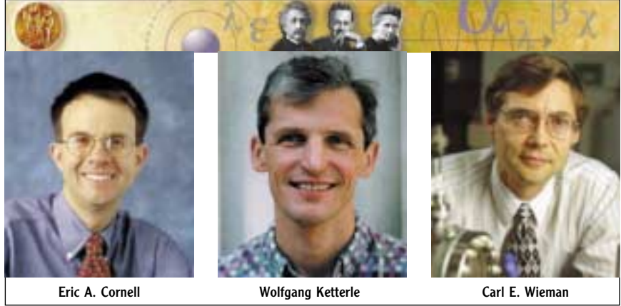
Eric A. Cornell

Bu yıl dağıtılan Nobel Bilim Ödülleri, her üç dalda da isabetli seçimler olarak değerlendirilirken, bu en prestijli ödülün 100. yıldönümü, değerlendirme mekanizmaları konusunda tartışmaların yeniden su yüzüne çıkmasına vesile oldu. Nobel Komitesi'nin uyguladığı başarı ölçütlerinin yeni tarifinin yapılmasını isteyenlerin sayısı kabarıyor. Genellikle deneysel doğrulanmayı temel alan geleneksel yaklaşıma itirazların biri; büyük kuramsal atılımların deneysel sonuçlarının ancak on yıllar sonra ortaya çıkabilmesi, bu nedenle de kuramcılarının başarılarının taçsız kalması. Tipik örnek, Einstein'ın görelilik kuramının Nobel onuruna erişememesi, büyük fizikçiyi bir biçimde ödüllendirmenin yolu olarak da kendisine 1921 yılında fotoelektrik etkisini keşfinden dolayı Nobel Ödülü verilmesi. Bir başka itiraz da ödül alan birkaç kişinin bilimsel gelişmelerin ve araştırmaların olağanüstü hız kazandığı günümüzde, aynı alanda benzer çalışmalar yürüten isimsiz kahramanları ne derece temsil ettikleri. Nitekim, son yüzyılda, insanlığın kaderini değiştiren sayısız buluşa karşın üç bilim dalında yalnızca 280 kişiye Nobel Ödülü verilmiş bulunuyor.