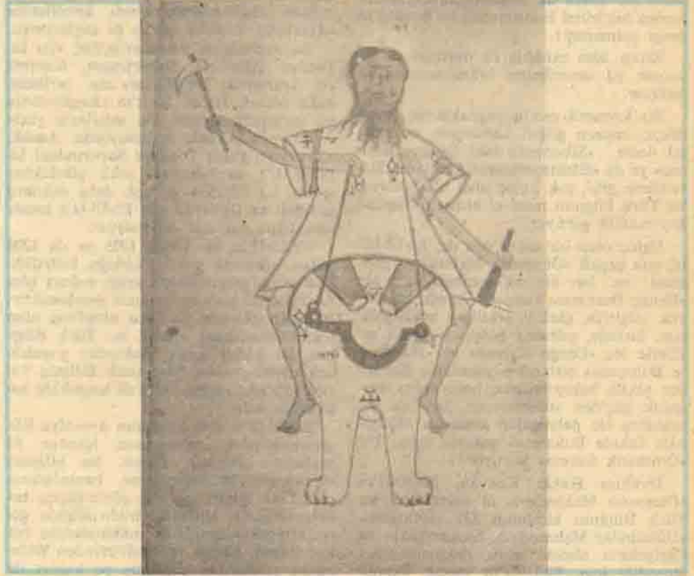
Otomatik fil ve otomatik adamın birlikte hareketi.

İbrahim Hakkı Konyalı, makalesinde, Cizreli Eb-ül-İz'in, bu konudaki kitabının «Kitab-ül cami-i beyn-el ilm-i v-el-amel